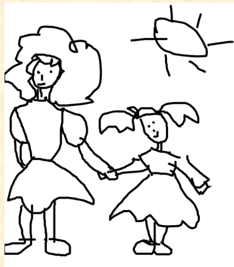
Я и мамочка