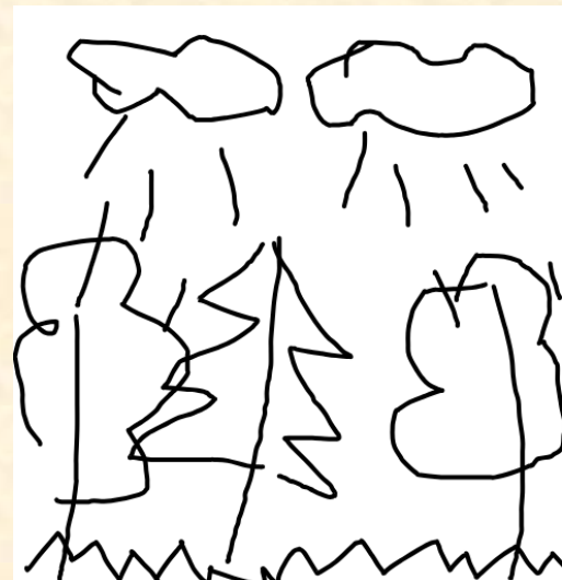
Дождь в лесу